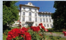
Schloss Bad Wurzach, Bad Wurzach