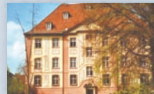
Schloss Kageneck, Munzingen