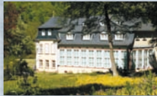
Schlösschen im Hofgarten, Wertheim