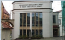
Kulturfabrik Kesselhaus, Trossingen