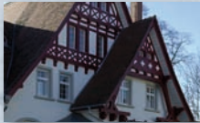
Gasthaus Gems, Rielasingen-Worblingen