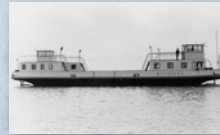
Historische Autofähre, Konstanz-Meersburg