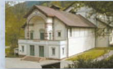
Kurtheater, Bad Wildbad

DENKMALSTIFTUNG BADEN-WÜRTTEMBERG Stiftung bürgerlichen Rechts