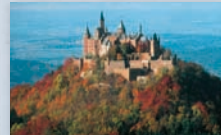
Burg Hohenzollern, Hechingen