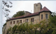
Burg Ravensburg, Sulzfeld